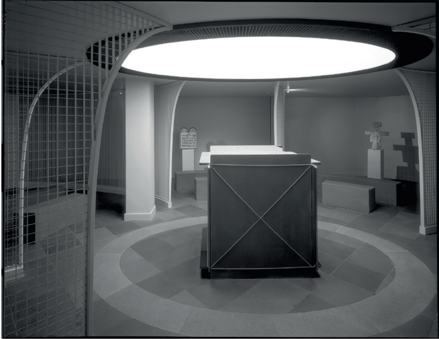
FIGURE 3 : VUE DU LIEU DE RECUEILLEMENT ET DE PRIÈRE PLURICONFESSIONNEL DE L'INSTITUT PAOLI-CALMETTES

Note : espace de 80 m 2 , au centre un Mètre cube d'infini, réalisé en miroir et pierre de Volvic, 2000.