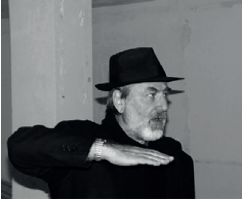
FIGURE 4 : M. PISTOLETTO À MARSEILLE EN 2000

« Le premier feu autour duquel se sont réunis les êtres humains était le centre de la société. La première pierre qui a rassemblé les hommes autour d'elle était à la fois sculpture et autel. La première personne qui a posé cette pierre au centre du groupe et qui a gravé les parois de la caverne était artiste et prophète. Cet espace de recueillement se veut aujourd'hui un lieu prophétique de l'art. »